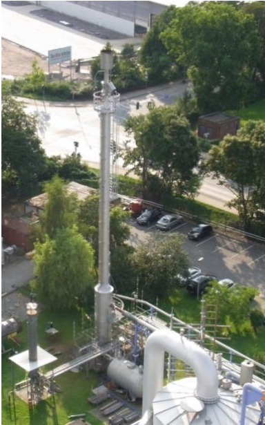
Umweltfackel in Bereitschaft...